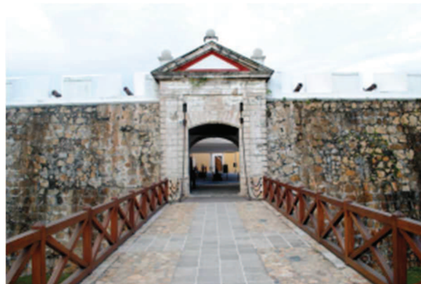
Fotografía de la portada: Fuerte de San Diego, Acapulco, Guerrero, México.